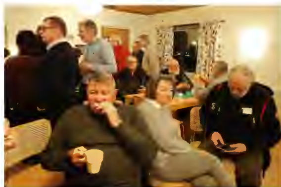
Välförtjänt fika efter effektivt möte!