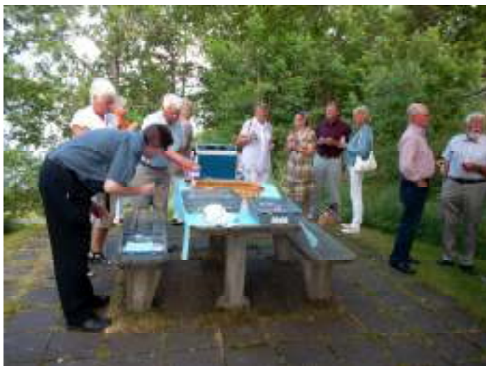
Drink vid Skenäs

Vi var fullsatt buss, 51 personer, som i Engstrands buss med Thomas som chaufför färdades på slingrande vägar till Bråvikenfärjan mellan Sandviken och Skenäs. Vid Skenäs blev det paus med melon och rosévin.