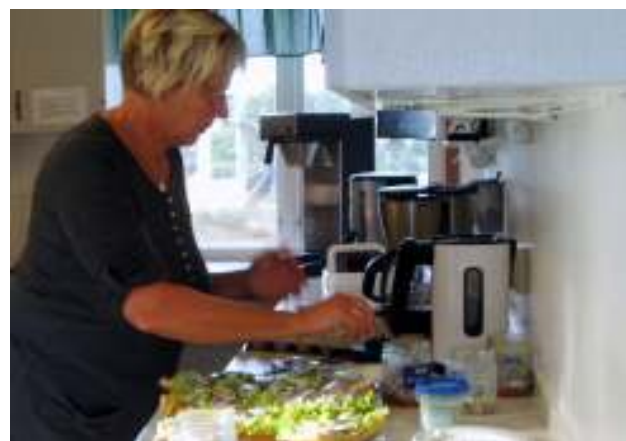
Mackor fixas...

medlemsavgifter vilket storligen förvånar t.ex. båtfolk från stockholmstrakten.