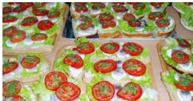
...och härliga blev de

60 goda mackor åt vi upp efter höststädningen och till detta serverades lättöl, cider och kaffe.