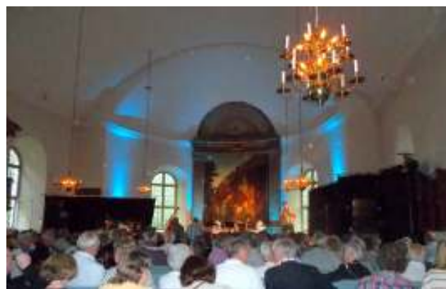
S:t Anna kyrka