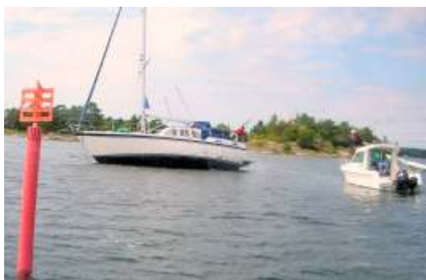
Båt på grund