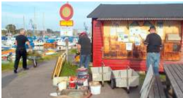
Sjöbod 101 rensades bl.a.

De bägge städdagarna i år har samlat mellan 45 och 55 deltagare som under ett par timmars tid kämpat för att göra vårt område rent och snyggt. I våras städades bl.a. under brädgångarna mellan sjöbodarna.