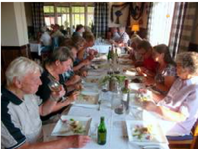
Middag på Mons Skärgårdskrog

Vidare gick färden via Söderköping och bron över Lagnöströmmen till Mons Skärgårdskrog på Norra Lagnö där en utsökt middag intogs bestående av vackra rätter som vi knappt kunde uttala namnen på.