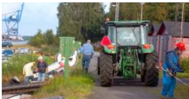
Hand- traktor- och trimmerkraft

Vi rensade anslagstavlor och sjöbod 101, på upp-läggingsplatser och jolleramper. klippte slänter, vägrenar och bakom båthallar. Snyggade till i och runt klubbhuset.