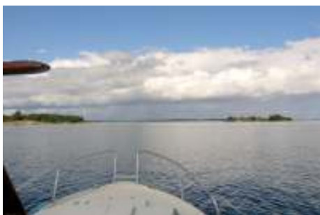
Utsikt från en båt