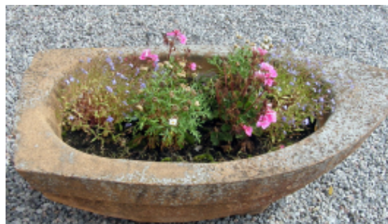
Hälsar en trött Pelargon.

Nu är vi slut och orkar inte lysa upp tillvaron längre.