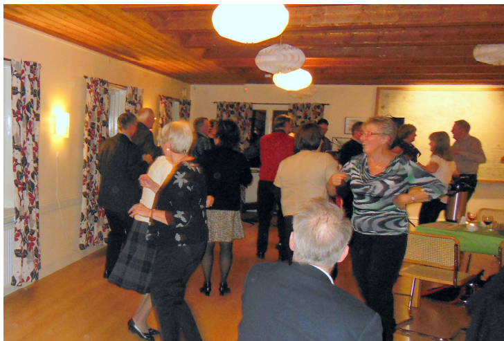
I dansens virvlar