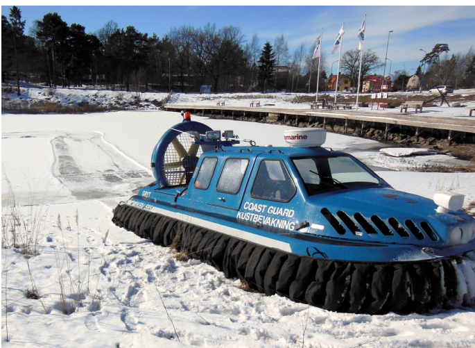
KBV 595 vid Rundbryggan

Det var Kustbevakningen från Gryt som var på besök. När vi senare gick hemåt igen fick vi se att den låg "parkerad" vid Rundbryggan. Lunchdags kanske?