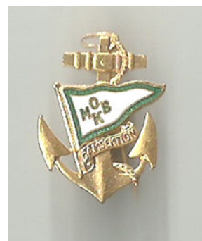
Eje Augustsson Medlem nr 42

★ Faktum är att hur långt ut på haven man än seglar, så är man oftast inte mer än två kilometer från land. Men det ligger rakt under en.