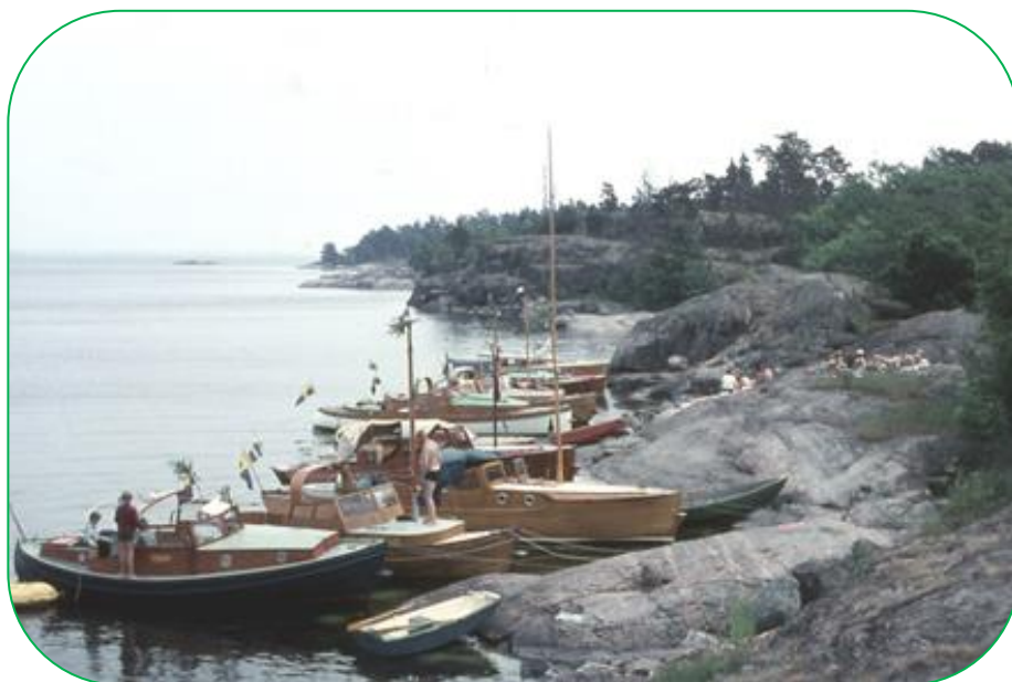
ÖBK-båtar i skärgården 1962, foto G Hjelm