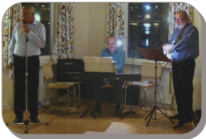
Ponthonerna håller igång under årsfesten 2015.

...hålls grillarna varma för de som vill komma för en stunds gemenskap innan kvällens begivenheter. Medtag vad du vill grilla och dricka. Klubbhuset hålls öppet som värmestuga.