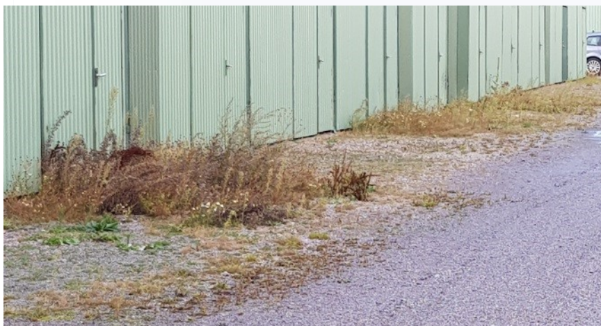
(Bilden ett exempel på hur det kan se ut. Tagen tidigare år)

Växtlighet har också växt upp utmed en del hallportar inom vårt område.